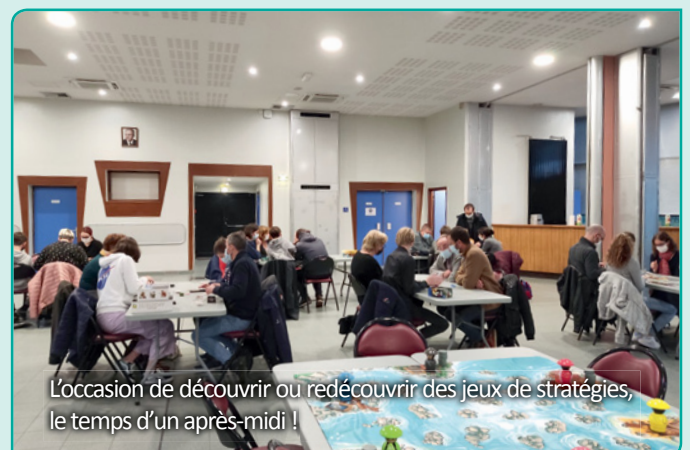
L'occasion de découvrir ou redécouvrir des jeux de stratégies, le temps d'un après-midi !