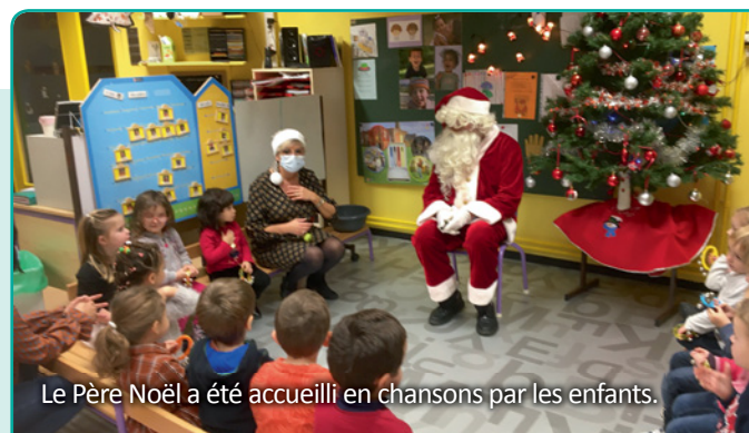
Le Père Noël a été accueilli en chansons par les enfants.