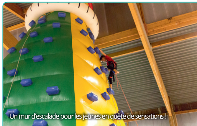
Un mur d'escalade pour les jeunes en quête de sensations !