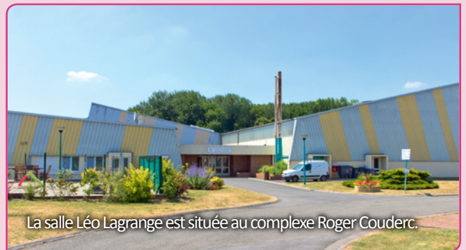
La salle Léo Lagrange est située au complexe Roger Couderc.

La salle Léo Lagrange est fermée suite à la découverte de fissures sur les poutres qui soutiennent l'armature du toit.