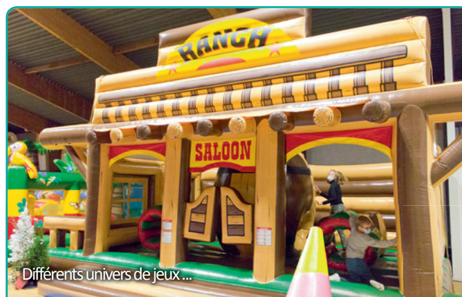
Différents univers de jeux...