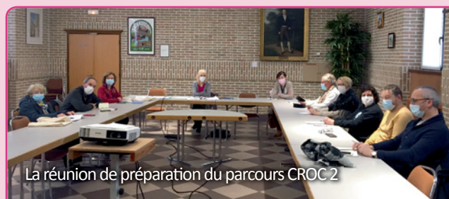
La réunion de préparation du parcours CROC 2

CROC, c'est l'abréviation de Consommer Responsable Oui mais Comment ? La ville de Cuincy organise la 2 e édition du parcours CROC (CROC 2), un programme sur mesures pour en apprendre plus sur l'alimentation saine, locale et durable (ateliers pratiques et visites pour développer et partager ses connaissances et savoir faire.)