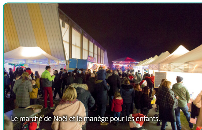
Le marché de Noël et le manège pour les enfants.