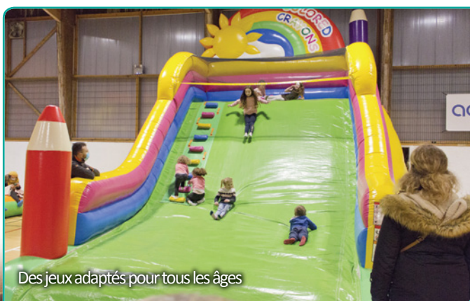
Des jeux adaptés pour tous les âges