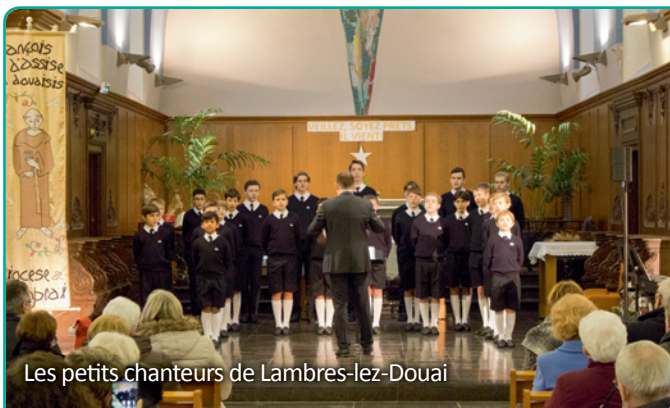
Les petits chanteurs de Lambres-lez-Douai

En fin d'année 2021, à Cuincy, Noël a repris ses droits avec un programme varié et riche en activités qui a donné l'occasion de se réunir et partager des moments de joie. Le samedi 18 décembre fut particulièrement chargé ! Tout a commencé à 15 h avec l'ouverture du marché de Noël au complexe Couderc, rue du Marais.