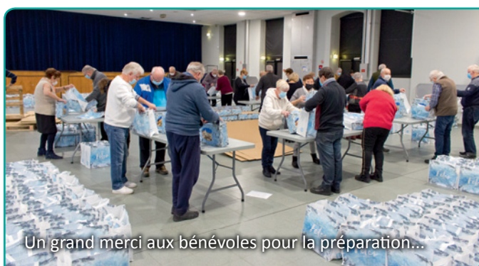
Un grand merci aux bénévoles pour la préparation...

Comme chaque année à l'approche des Fêtes de fin d'année, le traditionnel Colis a été offert aux Aînés par la Municipalité. Un geste fort apprécié par les récipiendaires qui leur apporte plaisir et réconfort.