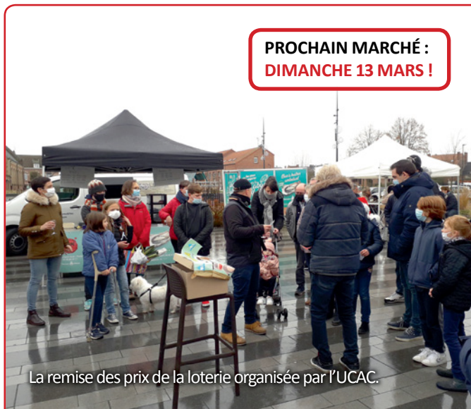
La remise des prix de la loterie organisée par l'UCAC.