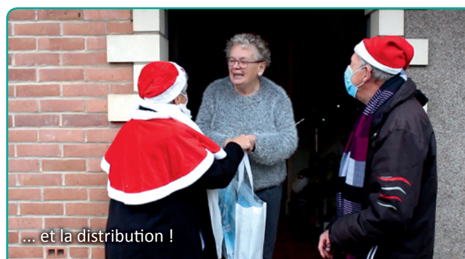
... et la distribution !