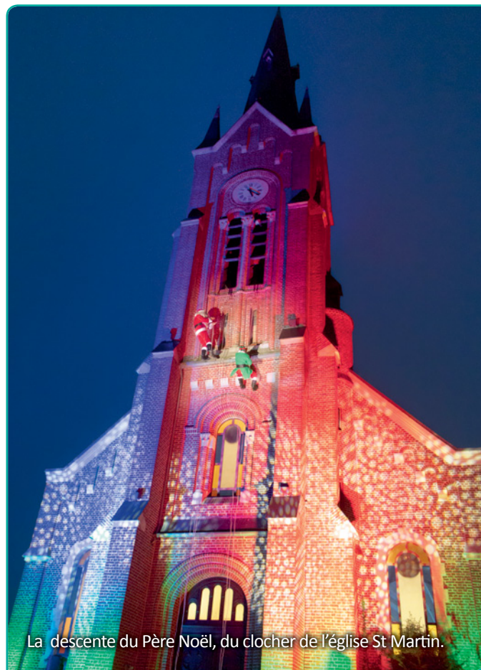
La descente du Père Noël, du clocher de l'église St Martin.

Enfin, un feu d'artifice à 19 h a clôturé cette après-midi bien remplie.