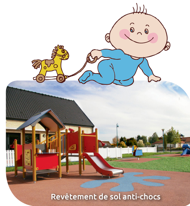
Revêtement de sol anti-chocs

Tout au long de la journée, le personnel veille à favoriser l'apprentissage de la propreté (mise au pot, passage aux toilettes, lavage des mains) pour les enfants de plus de 18 mois.