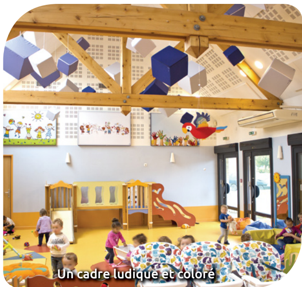
Un cadre ludique et coloré