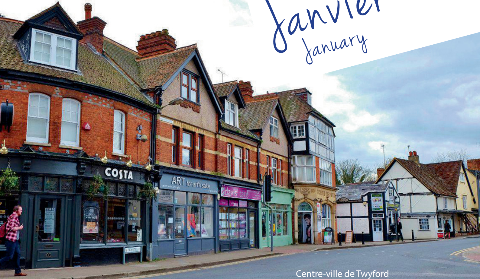
Centre-ville de Twyford Downtown - Twyford