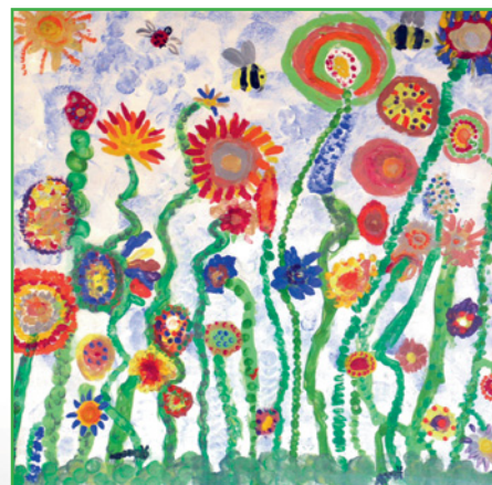
Artwork by all the children in Art Club at the Colleton School

Vacances de Noël : du samedi 21 décembre 2019 au lundi 6 janvier 2020.